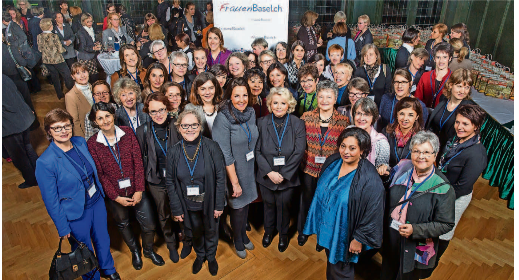
Basler Frauen auf dem Weg ins neue Jahr.